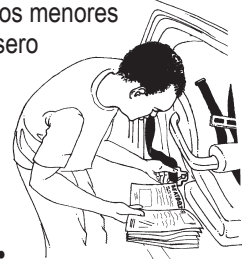
Use el manual del auto para aprender cómo instalar el asiento de seguridad.