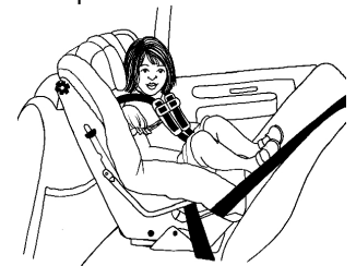
A. Niño pequeño mirando hacia atrás en asiento convertible