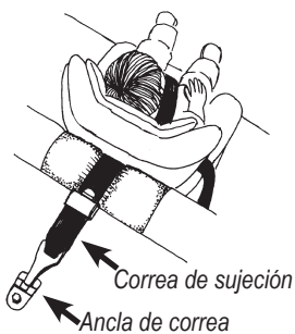
B. Asiento que mira hacia adelante con correa de sujeción

Si necesita ayuda, pídale al padre del hijo, o busque una estación de inspección de seguridad de pasajeros infantiles (vea Recursos).